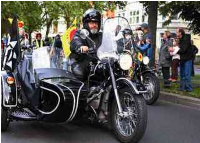
Der IGG-Uralstammtisch unterwegs mit dem "Anti Atom Treck 2009"

Als im Artikel zum letzten Sommer-treffen vom „Ural Stammtisch der