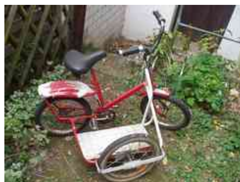
Für Anfänger ? Oder für absolute Könner?