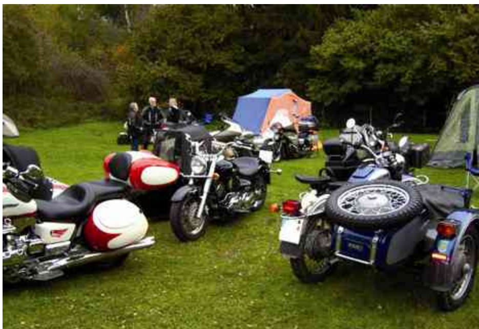
Viel Platz bei den Motorradfreunden

Die Mitglieder der IGG sind gern gesehene Gäste. Ob in Holle, früher in Berßel oder beim Sommertreffen in Winsen. Nun waren wir nach Hornburg eingeladen. Die Motorradfreunde Iberg haben dort ein eigenes Vereinsgelände und boten es der IGG für das Herbsttreffen an.