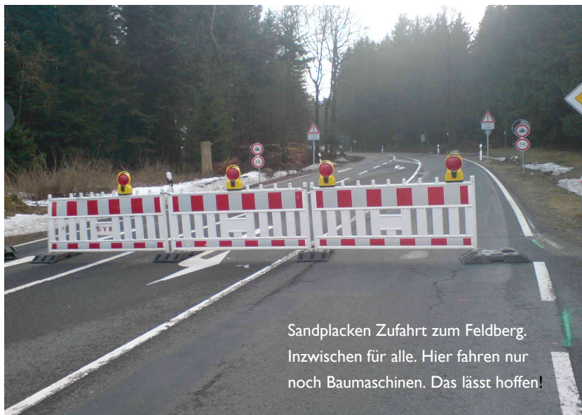
Sandplacken Zufahrt zum Feldberg. Inzwischen für alle. Hier fahren nur noch Baumaschinen. Das lässt hoffen!

„Honi soit qui mal y pense“, oder zu deutsch „ein Schelm, wer schlechtes dabei denkt