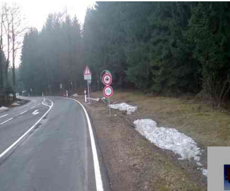
Sandplacken Zufahrt zum Feldberg, Sperrung für Zweiradfahrzeuge

Vielen Anwohnern in den Gemeinden rund um das Feldbergplateau ist der Treffpunkt der Motorradfahrer seit Jahren ein Ärgernis und wird regelmäßig angefeindet. Immer wieder sind es natürlich die Unfälle, die mitunter auch tödlich ausgehen, sowie rücksichtsloses Verhalten von Zeitgenossen aus