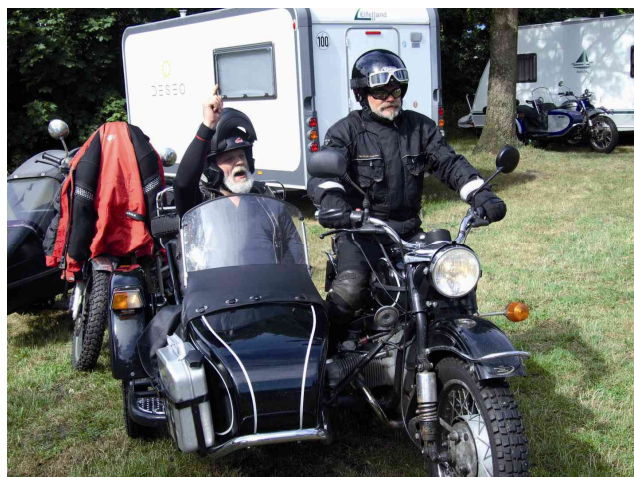
Kann der Hondafahrer (im Beiwagen) überzeugt werden?