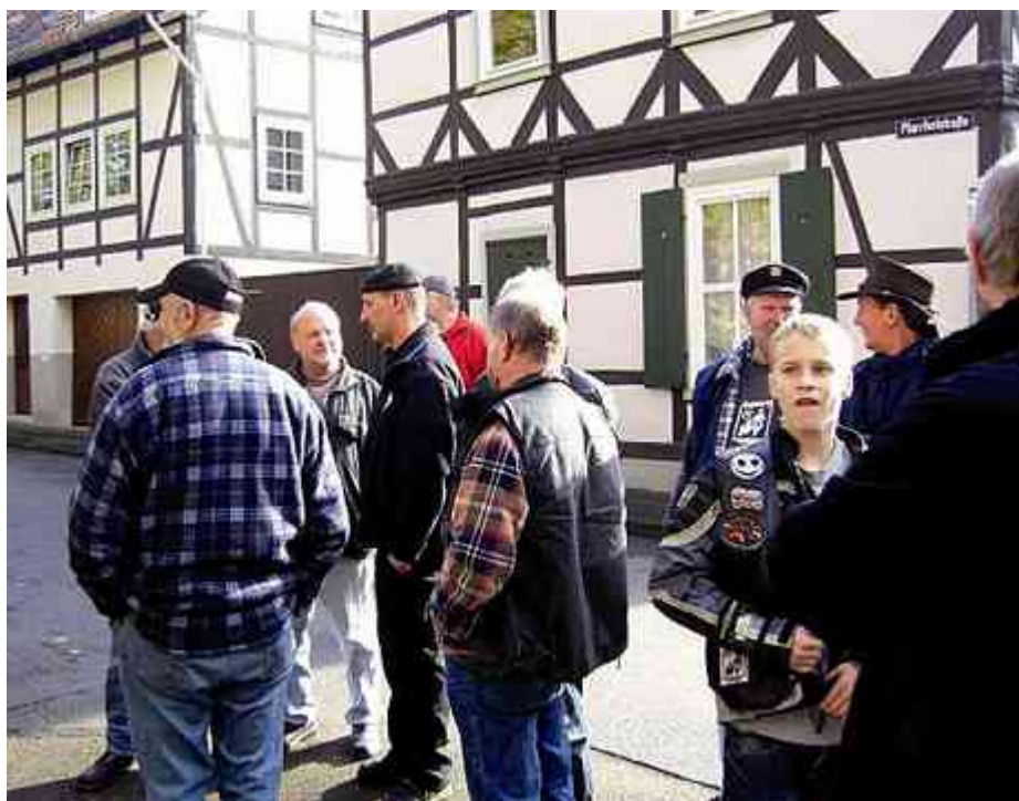
Warten auf die Stadtführung

städtchen Hornburg erkunden. Exklusiv für das IGG-Treffen wurde der Fremdenführer engagiert. Und nicht wenige nahmen an der Stadt-