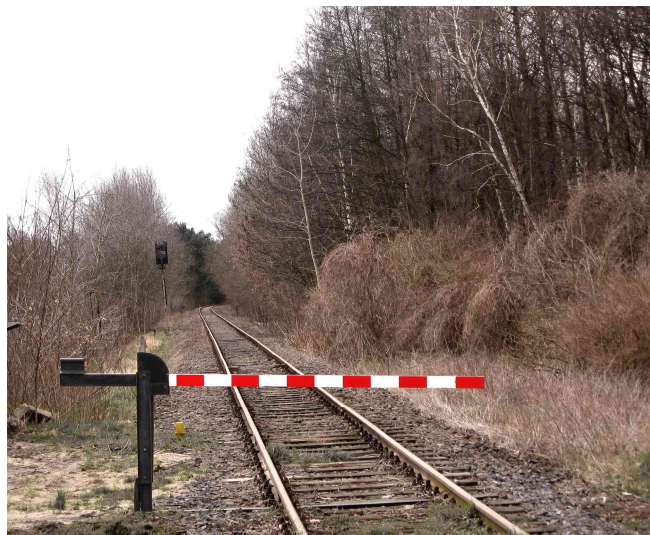
Streckensperrung mal anders!!!